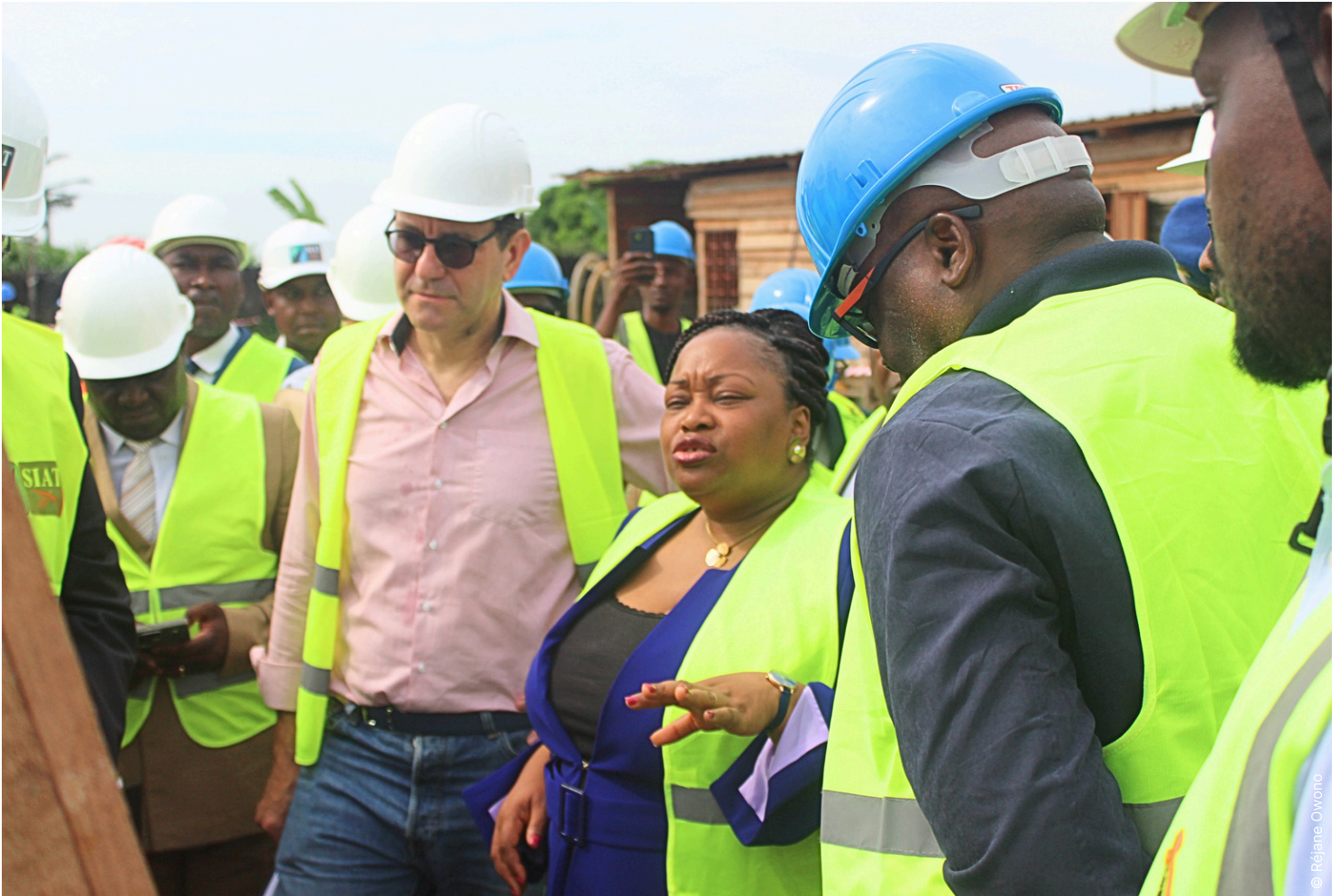
VISITE DU SITE DU LYCÉE PUBLIC D'AKÉBÉ 2 EN COURS DE RÉHABILITATION

Une mission de terrain conduite dans le Grand Libreville par la Ministre d'Etat, en charge de l'Éducation Nationale, aux côtés de l'Ambassadeur de France au Gabon, du Directeur de l'AFD et de l'Unité de Gestion du Projet PISE, pour une visite de suivi des chantiers de la phase 2 dudit Projet.